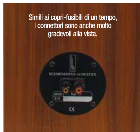
Simili ai copri-fusibili di un tempo, i connettori sono anche molto gradevoli alla vista.