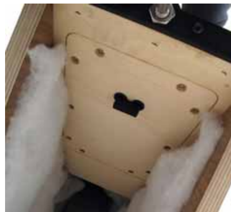
Questa foto piuttosto misteriosa mostra la cavità, dal basso, dei diffusori. L'oggetto nero sulla parete è il ponticello del crossover.

Solo in seguito mi sono accorto dell'accresciuta quantità e spessore delle informazioni che questo diffusore mi offriva, senza esibizione della sua bravura, quindi senza stress, facendosi totalmente da parte rispetto allo scorrere della musica. Ho rilevato la spontaneità tipica dell'alta efficienza, connessa però ad una qualità, a un desiderio di piacere non espresso dalla solita superficiale musicalità, e tale che le prestazioni del Fun 17 andrebbero additate come riferimento per ogni brano, nonostante le differenti richieste dei vari generi musicali.